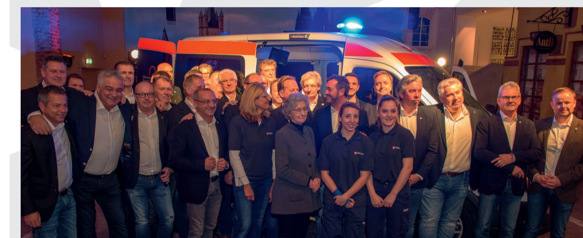
Fahrzeugenthüllung im Kölner Karnevalsmuseum: Kölsche Fründe Botschafter und Malteser Herzenswunsch-Teams präsentieren den neuen Herzenswunsch-Krankwagen.