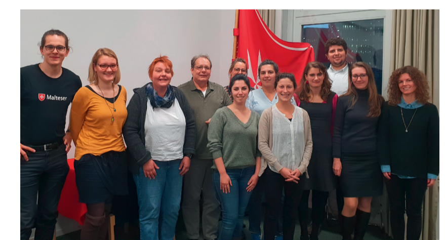
Die Delegation aus Köln und NRW mit den Münchner Fachkolleginnen und -kollegen

Das Team der Malteser Flüchtlingshilfe im Erzbistum Köln besuchte gemeinsam mit dem NRW-Projektteam der BAMF-Erstorienkurse vom 8. bis 10. November die bayerische Landeshauptstadt und traf vor Ort zum gemeinsamen Austausch den Münchner Diözesanreferenten und die Ehrenamtskoordinatoren. Schwerpunkt war das Thema Arbeitsmarktintegration von Geflüchteten. Auch das Rahmenprogramm der zweitägigen Reise drehte sich rund um das Thema Migration. Um den gelungenen Erfahrungsaustausch weiter zu intensivieren soll es im nächsten Jahr einen Gegenbesuch der Münchner Malteser in Köln geben. Mehr unter: https://bit.ly/2QZjzc .