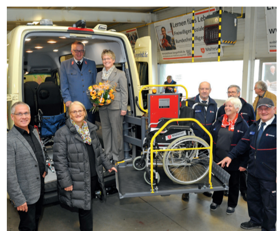
Der neue MEW ist den Bedürfnissen der Fahrgäste angepasst.

Die Malteser in Langenfeld konnten am 20. November ihren neuen „Mobilen Einkaufswagen“ (MEW) vorstellen. Mit einem Zuschuss der GlücksSpirale über 44.453 Euro konnte das behindertengerechte Fahrzeug für den neuen Dienst bestellt werden.