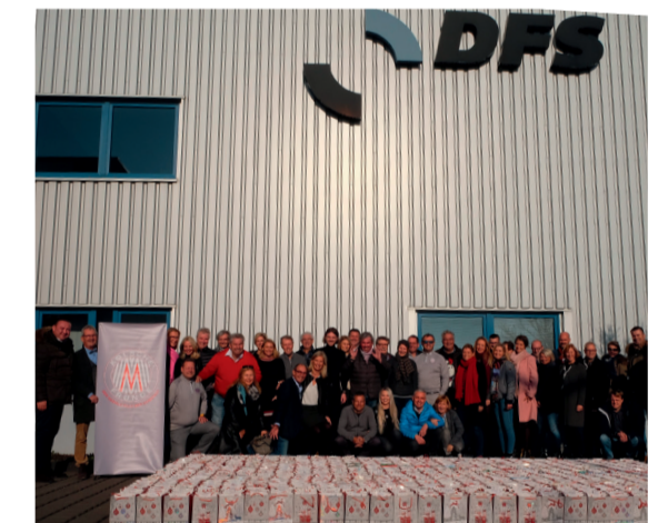
Die Kölsche Fründe Botschafter und ihr Fördernetzwerk packten bei DFS Druck in Marsdorf 1.000 Weihnachtstüten für sozial benachteiligte Kinder in der Kölner Region.

Mehr als 45 „Kölsche Fründe“ Botschafter und ihr Fördernetzwerk packten am 23. November in weniger als zwei Stunden 1.000 Weihnachtstüten für sozial benachteiligte Kinder in der Kölner Region. Die Packhülle des großen Familienbetriebes DFS Druck Brecher GmbH in